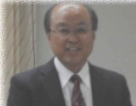
中央本部 東中執行委員長